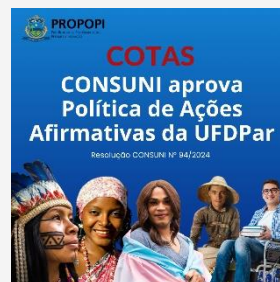
COTAS CONSUNI aprova Política de Ações Afirmativas da UFDPAr Resolução CONSUNI Nº 94/2024

10/10 UFDPAr aprova novas políticas de cotas para pessoas trans e outros grupos vulneráveis