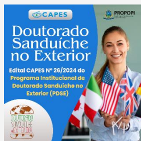
Doutorado Sanduíche no Exterior Edital CAPES Nº 26/2024 do Programa Institucional de Doutorado Sanduíche no Exterior (PDSE)

10/10 UFDPAr divulga Edital CAPES Nº 26/2024 do Programa Institucional de Doutorado Sanduíche no Exterior