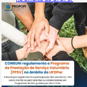
CONSUNI regulamenta o Programa de Prestação de Serviço Voluntário (PPSV) no âmbito da UFDPAr A Resolução regulamenta a participação dos servidores FAs como membros permanentes ou colaboradores em programas de pós-graduação da UFDPAr.

09/10 CONSUNI regulamenta o Programa de Prestação de Serviço Voluntário (PPSV) no âmbito da UFDPAr