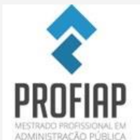
PROFIAPIA MESTRADO PROFISSIONAL EM ADMINISTRAÇÃO PÚBLICA

16/10 Edital Nº 17/2024 - Chamada para credenciamento de novos docentes ao Programa de Mestrado em Administração Pública da UFDPAr