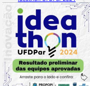
idea thon UFDPAr 2024 Resultado preliminar das equipes aprovadas

17/10 Resultado final das equipes aprovadas - Edital Nº 10/2024 – PROPOPI – Ideathon UFDPAr 2024